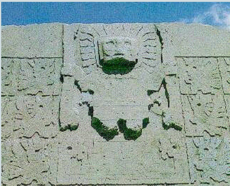
Puerta del Sol

En la tercera columna de la parte derecha se observa la cabeza de un elefante y esto es sorprendente pues no existen elefantes en América, aunque sí habían existido en tiempos prehistóricos. Los miembros de una especie llamada Cuvieronius, un proboscideo parecido a un elefante que estaba dotado de colmillos y trompa, de aspecto extraordinariamente similar a los "elefantes" de la Puerta del Sol, habían abundado en la zona meridional de los Andes, hasta su repentina extinción hacia el 10.000 a.C.